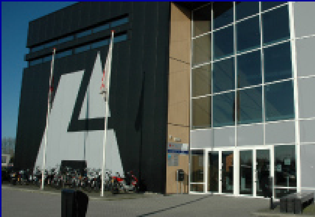
locatie Alfa - Kardingerweg 48 9735 AH Groningen