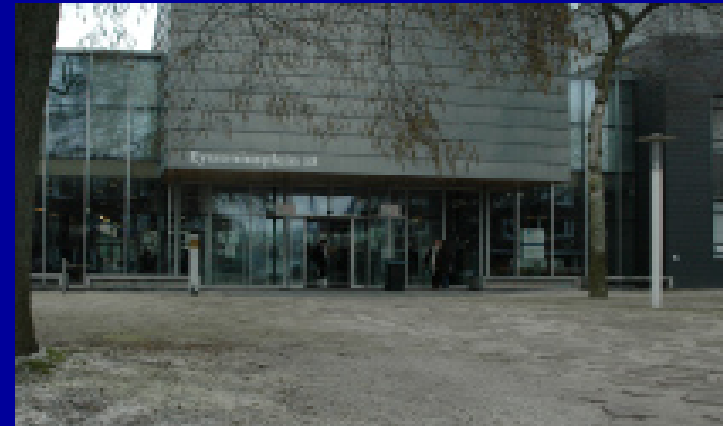
locatie Hanze - Eyssoniusplein 18 9714 CE Groningen